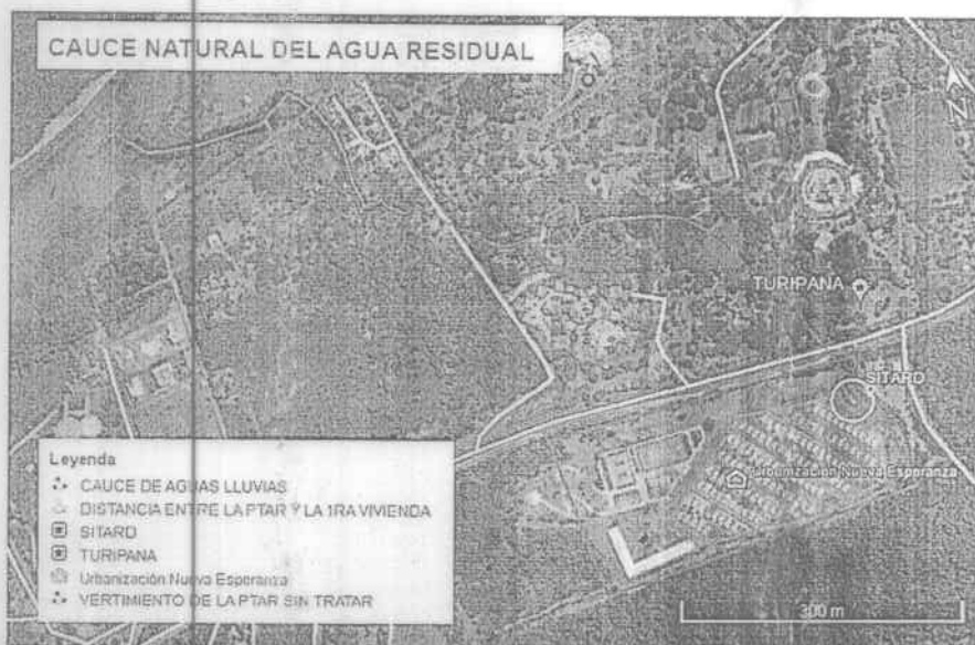
Imagen N° 3. Cauce y radio de acción del agua residual rebosada.

Posteriormente y por el canal de aguas lluvias sigue avanzando y penetra a los predios del centro recreacional de COMFAMILIAR - Turipana, tal y como se evidencia en la imagen N° 3.